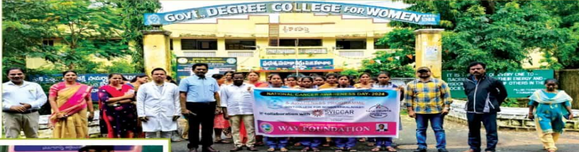
వే ఫౌండేషన్ ఆధ్వర్యంలో క్యాన్సర్ నిర్వహిస్తున్న ప్రభుత్వ మహిళా డిగ్రీ కళాశాల విద్యార్థినులు