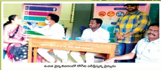
ఉపాధ్యక్షురాలిని రోగిని పరిశీలిస్తున్న వైద్యుడు